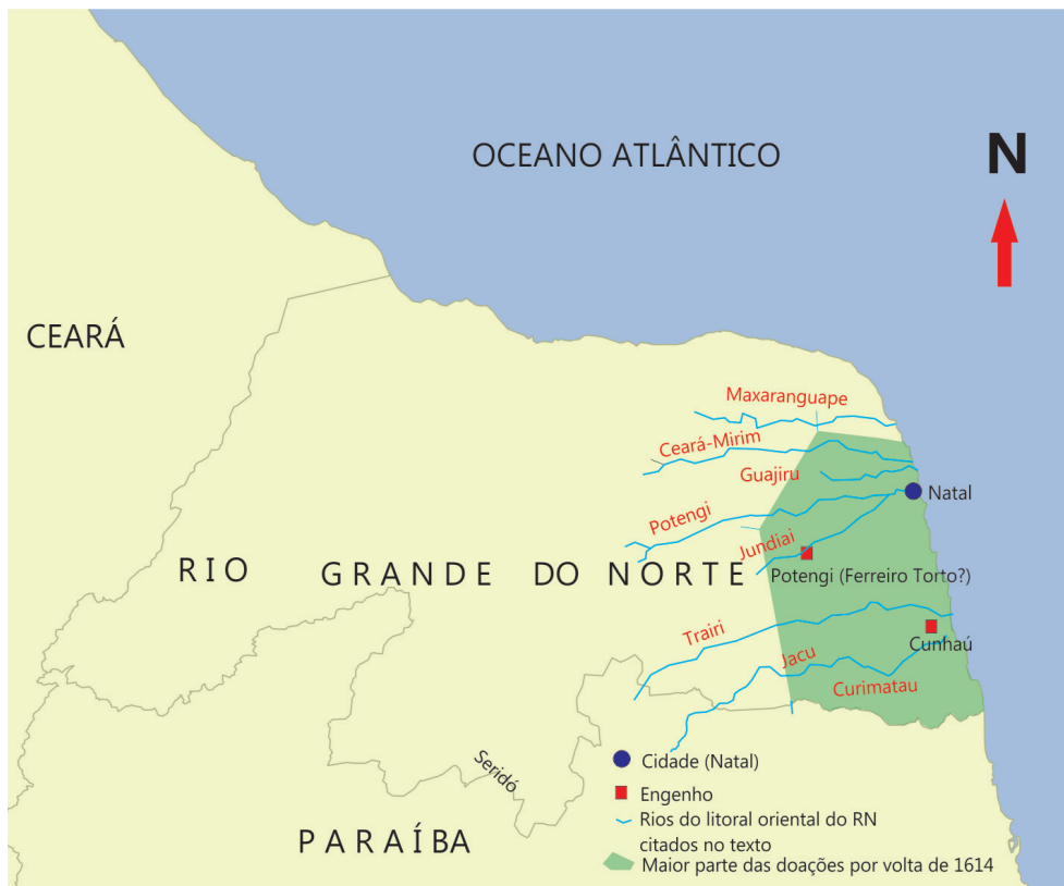
Figura 1 - Localização aproximada, no mapa atual do Rio Grande do Norte, da maior parte das doações de terra por volta de 1614. Base cartográfica de Luana Cruz modificada pelo autor.

A data cento e vinte e um deu Jerônimo de Albuquerque a Agostinho Pereira em vinte e dois de maio de seiscentos e sete, é uma data que está dentro da demarcação da Paraíba, do [Rio] Guajú para o sul. A data de cento e vinte e dois deu Jerônimo de Albuquerque a João Marques em vinte de agosto de seiscentos e sete, é uma légua em quadra e na testada de Agostinho Pereira, cai na demarcação da Paraíba.