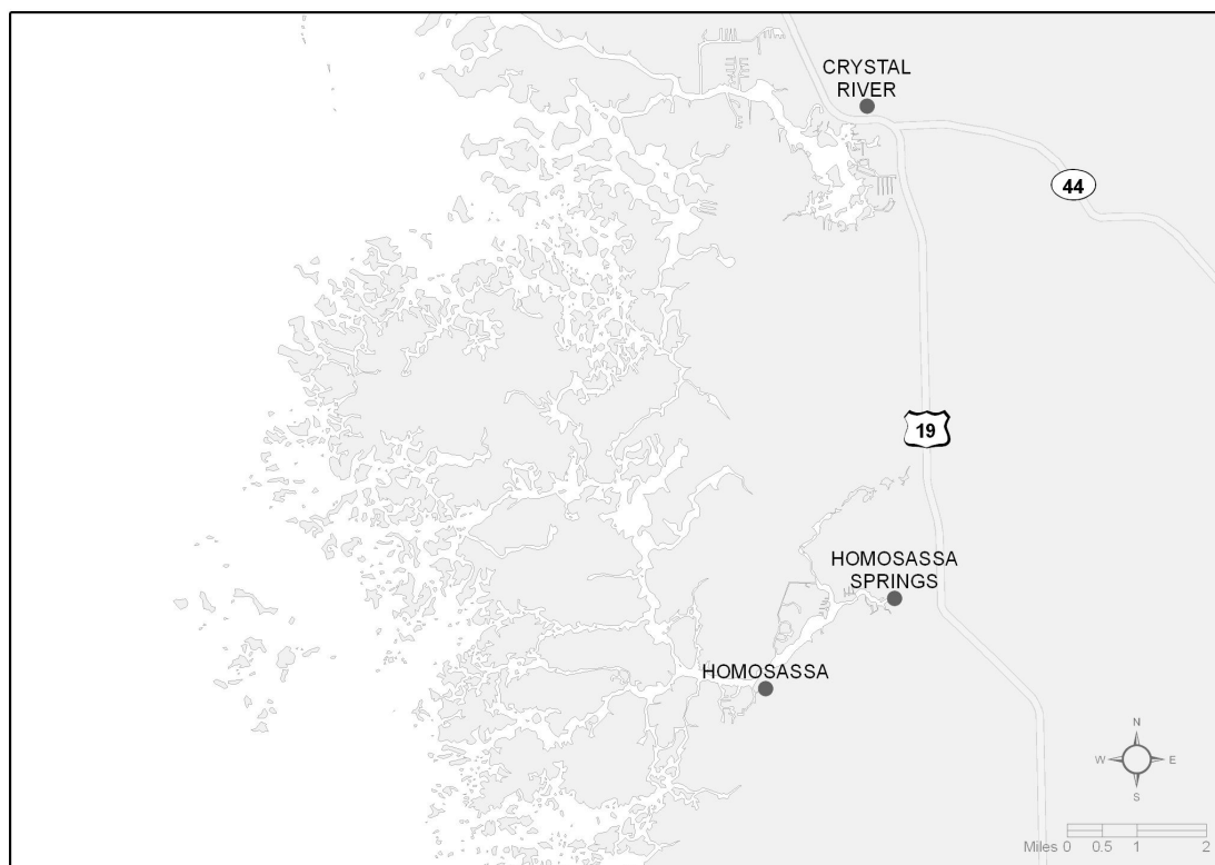
Figura 3 - A paisagem do carste litorâneo de Ozello, Flórida.