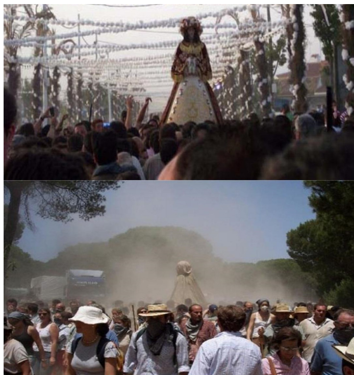
Figura 4 - A Virgem retorna a Aldeia do Rocio