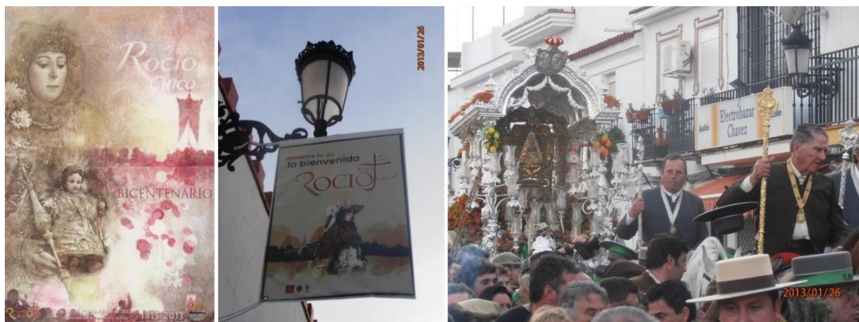
Figura 1 – Cartaz do Bicentenário e Ano Jubilar em Almonte saudando a Irmandade de Triana

e confederativa, do Estado Espanhol das Comunidades Autônomicas (HENARES CUÉLLAR, 2010). E neste quadro, a articulação dos bens patrimoniais andaluzes – incluindo as festividades e seus cenários – evoluiu conforme uma leitura vinculada à produção cultural dos bens históricos patrimoniais. (ESCALERA REYES, 2002)