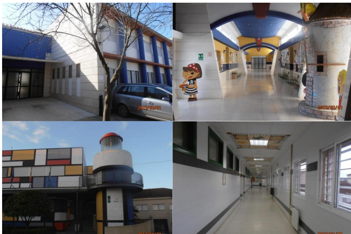
Figura 2 - Imagens dos Institutos visitados e pesquisados: La Ribera (acima); Doñana (abaixo)

e professores) com valorização da cidade em festa. Ali está matriculado um expressivo número de estrangeiros e descendentes de imigrantes (africanos, latino-americanos, europeus orientais), demonstrando a forte preocupação com a estruturação de projetos técnicos de inclusão social. Por outro lado, há também, a percepção da interdependência entre o calendário escolar e os múltiplos eventos da festividade rocieira.