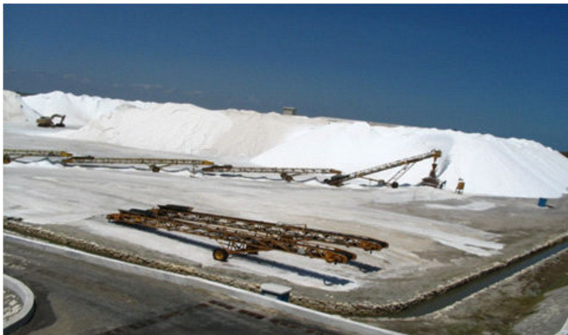
Figura 2 - Salinas no estuário do rio Apodi-Mossoró. (Setembro, 2005)