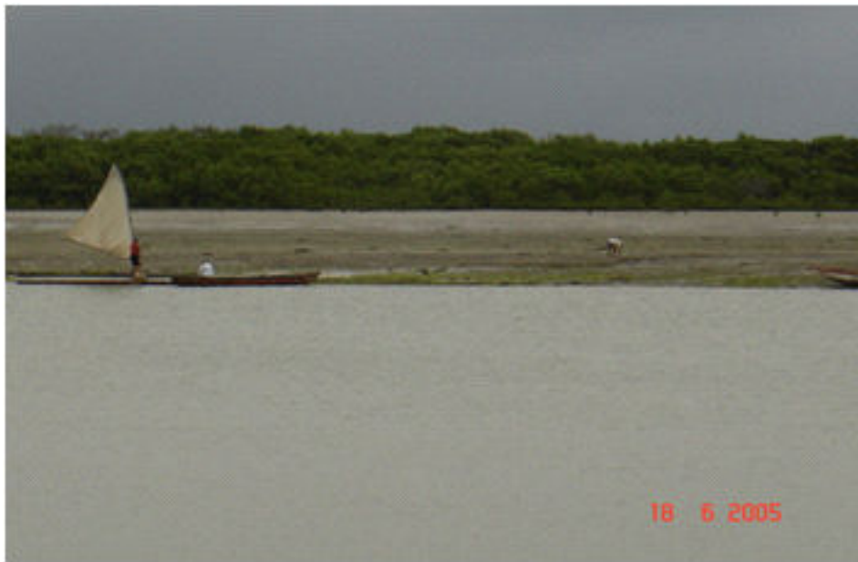
Figura 3 - Canal do Rio Mossoró assoreado.