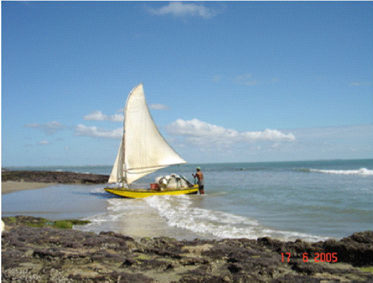
Figura 5 - Praia de Upanema. (Junho, 2005)

presença de recifes de arenito na forma de franjas. Os solos predominantes são os Neossolos Quartzarênicos relacionados as areias e algumas manchas de Planossolos Nátricos e Gleissolos Sállicos nas proximidades com a planície fluvio-marinha.