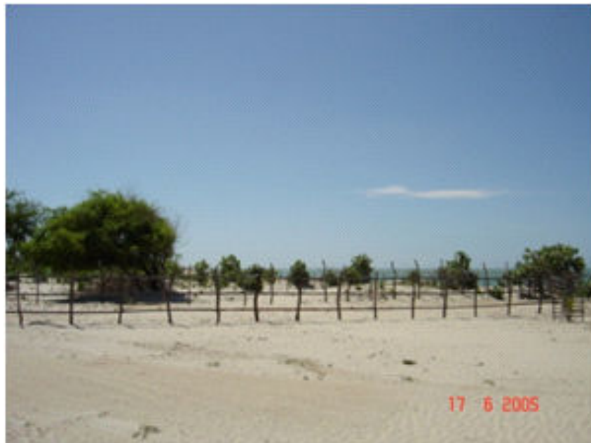
Figura 6 e 7 - Praia de areia branca, ocupação descontrolada. (Junho, 2005)

As fragilidades ambientais da planície litorânea, incluído tanto as praias, como as dunas, estão diretamente relacionadas com seu frágil equilíbrio ecológico e o uso inadequado e sem medidas de preservação que vem sendo submetida desde que o homem passou a ocupá-las.