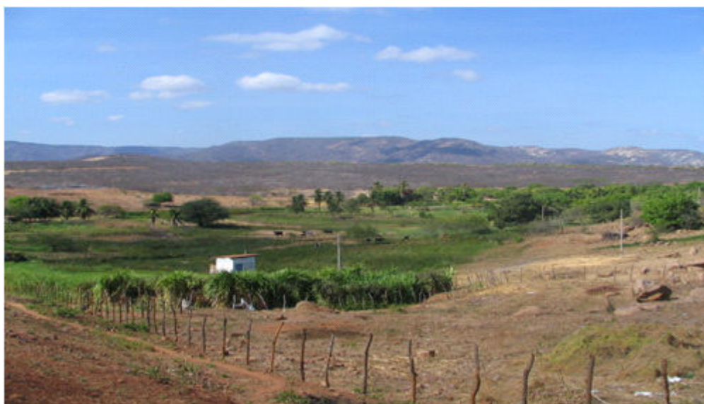
Figura 8 - Planície Fluvial ocupada por cultura de vazante, proximidades da cidade de Riacho da Cruz. (novembro 2005).

As fragilidades ambientais nesta paisagem estão representadas pelo forte assoreamento do canal fluvial Apodi-Mossoró, e de seu afluente principal o rio do Carmo, inundações de suas várzeas nas áreas urbanizadas, remoção da cobertura vegetal, poluição das águas por esgotos doméstico e industrial, erosão marginal de suas barrancas, alteração do leito maior e menor e captação de água sem fiscalização.