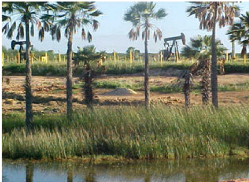
Figura 4 - Margem do Apodi-Mossoró e exploração de Petróleo em meio aos carnaubais. (Junho, 2005). Autor: Rocha, F. A.