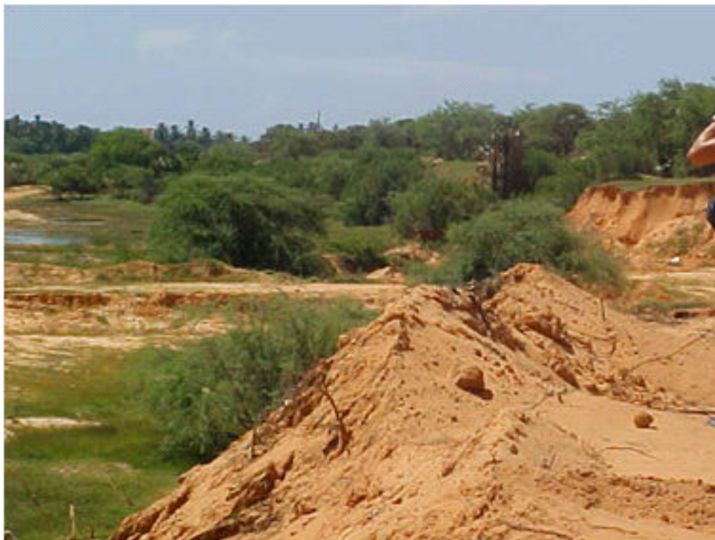
Figura 1: Tabuleiros Costeiros bastante antropizado, Fonte: Rocha, F. A. (novembro 2005).

A chapada é uma grande superfície cárstica, onde predominam os cambissolos e os latossolos eutróficos, ambos fertilizados e de alta fragilidade natural. Os topos planos da chapada apresentam depressões rasas, com água ocupada por carnaúbas. Nesses topos a drenagem não é concentrada devido a grande permeabilidade dos calcáreos e não há uma rede fluvial organizada.