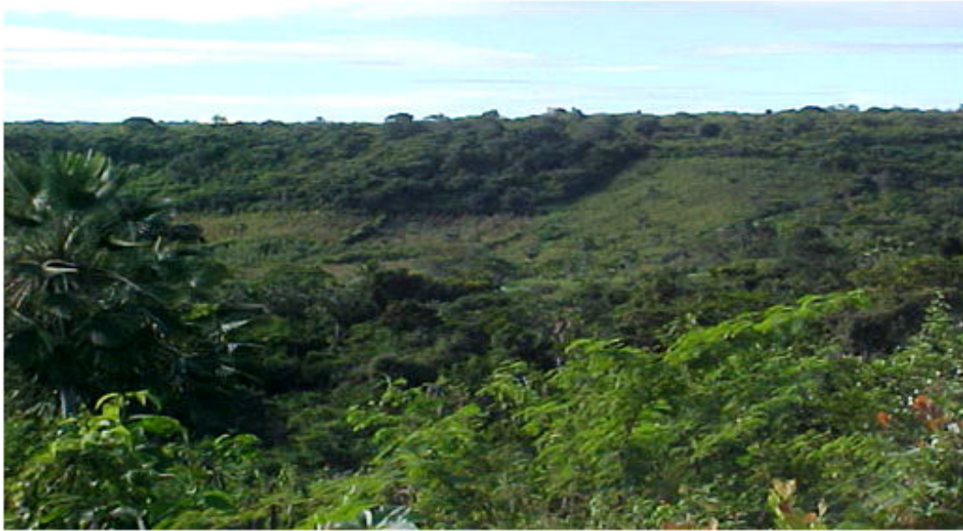
Figura 9 - Serra de Martins – topo tabular