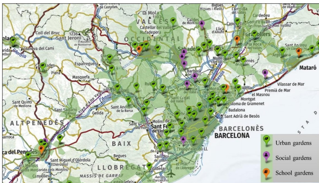
Figura 1 - Algumas das hortas existentes na área metropolitana de Barcelona (Catalunha). Fonte: Xarxa de Ciutats i Pobles cap à la Sostenibilitat. Julho de 2017. Mapa desenvolvido, usando diferentes fontes, por Jordi Montagut Alandi como resultado de um estágio no Conselho Provincial de Barcelona.