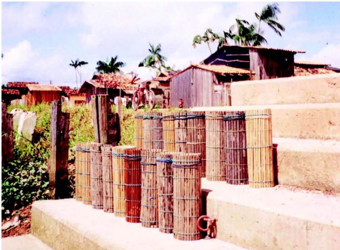
Figura 3 - Conjunto de matapís Alocados na escadaria de um pequeno porto que seria construído pela PMB, revela um exemplo de convivência de temporalidades.

Nesse sentido, a Amazônia é reconhecida por suas diversas singularidades no tempo e no espaço, o que dificulta o esboço de uma particularidade regional. No entanto, o homem amazônico é muito ligado à natureza em que vive, designadamente como os rios e igarapés, isto porque esta é sua fonte de alimentos, de lazer, de trabalho e de deslocamento.