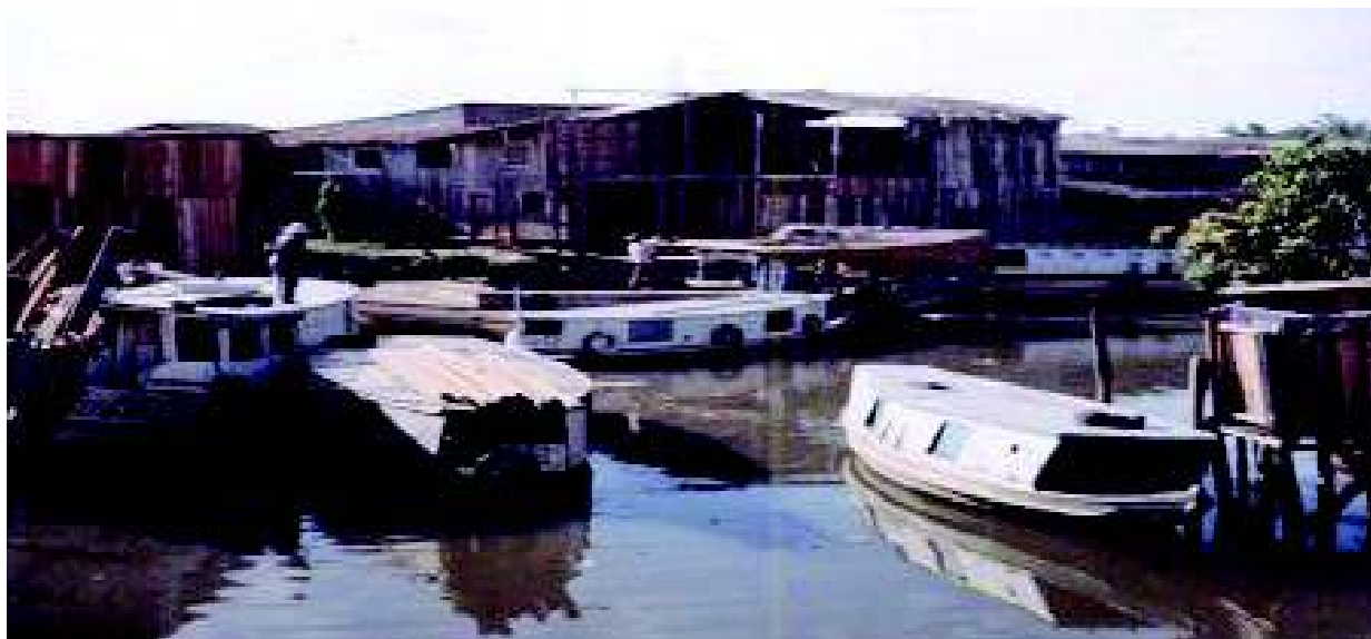
Figura 2 - Orla do Riacho Doce

local de origem, ou então que um ou mais membros da família deslocam-se para estas localidades, durante um determinado período (SOUZA, 2003). Entre as mercadorias encontramos madeiras, frutas regionais, tijolos, telhas, palha, açai.