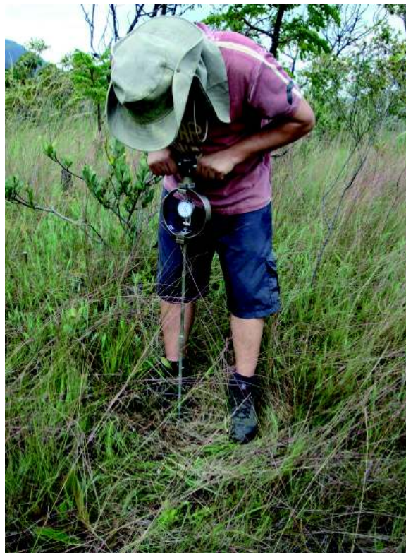
Figura 2 – Utilização do penetrômetro de cone com anel dinamométrico R. C. Takeuchi (2009)

Para efetuar as medições, posiciona-se o penetrômetro verticalmente, aplicando pressão manual o mais constante possível, até introduzir totalmente o cone no solo (Fig. 2). As medidas foram lidas em Kgf (quilograma-força), realizando a leitura no dinamômetro analógico instalado no anel dinamométrico do penetrômetro, e convertendo-as para a carga aplicada. Essa carga é obtida lendo no gráfico que acompanha o equipamento (curva de calibração do anel), ou interpolando, a partir da tabela de calibração, a carga máxima de penetração registrada no dinamômetro.