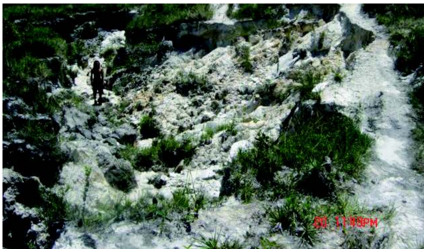
Figura 4 - Voçorocamento localizado num antigo traçado da Trilha Farofa. Observar o avanço do processo erosivo sobre leito da trilha à direita da foto (DUARTE, 2009).

Algumas implicações relacionadas à abertura de trilhas e compactação do solo podem ser verificadas ao longo da Trilha Farofa, relacionadas à ocorrência de feições erosivas lineares aceleradas (voçorocamentos), resultando em grave degradação em segmentos específicos da mesma (ALMEIDA, 2005; GUALTIERI-PINTO, 2008; GUALTIERI-PINTO et al, 2008; DUARTE, 2009). Isso coloca em risco a integridade física do visitante (Fig. 4), obrigando os gestores da unidade de conservação a criarem outro traçado para o segmento afetado, desviando-o do problema erosivo.