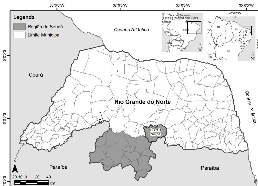
Figura 1 – Mapa de localização da área de estudo.

Caracteriza-se por um clima semiárido quente e seco que limita as atividades agrárias, tendo em vista a distribuição irregular das escassas chuvas ao longo do ano. As médias de precipitação giram em torno de 500 mm/ano e as temperaturas médias em torno de 28°C (IICA, 2000).