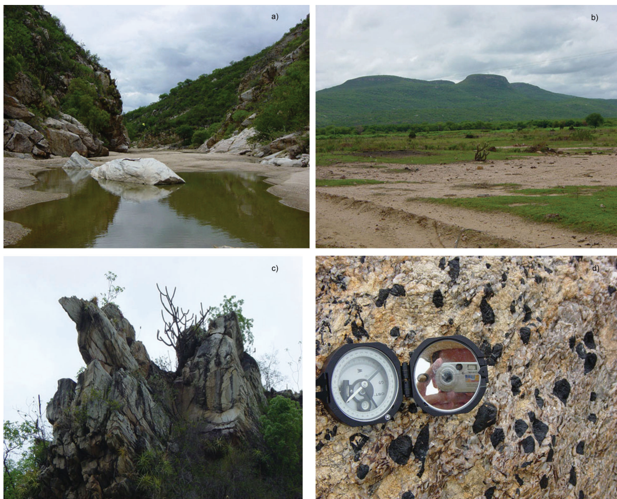
Figura 4 – Geopatrimônio na área do Canyon dos Apertados: a) rio Picuí e Canyon dos Apertados; b) Serra do Chapéu; c) afloramentos quartzíticos decorrentes da dissecação do relevo, onde é possível se observar registros de falhamentos; d) pegmatito mineralizado em turmalinas.