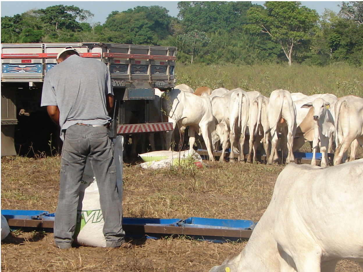
Figura 3 - Peão pantaneiro na lida com o gado, destaque: equipamentos de comunicação, transporte, uniforme da empresa e cocho para suplementação da alimentação animal.