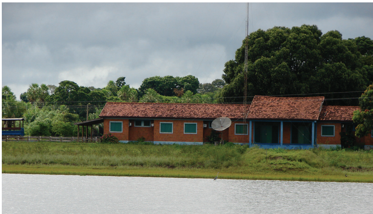
Figura 1 - Pousada no Pantanal, destaque antena parabólica e aparelhos de ar condicionados. Autora: RIBEIRO, M. A. março 2002.

Um dos exemplos das novas práticas na pecuária é a alimentação do gado, que há alguns anos era feita com a vegetação nativa e suplementada apenas com sal, atualmente os animais estão recebendo suplementação nutricional, constituída principalmente de mistura mineral. Em uma entrevista, FP - nesse artigo os entrevistados são identificados pelas iniciais com o objetivo de resguardar as identidades - afirma que: “Algumas empresas pecuárias, aos poucos, estão fornecendo concentrados proteicos para animais jovens, para acelerar o desenvolvimento e procedendo a terminação dos animais em confinamento, com acompanhamento de médicos veterinários e zootecnistas”.