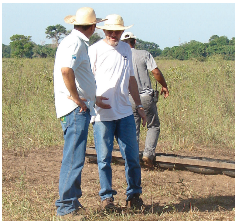
Figura 2- Gerente de empresa pecuária, médico veterinário e em segundo plano peão. Autora: RIBEIRO, M. A. fevereiro 2011.

Um dos exemplos das novas práticas na pecuária é a alimentação do gado, que há alguns anos era feita com a vegetação nativa e suplementada apenas com sal, atualmente os animais estão recebendo suplementação nutricional, constituída principalmente de mistura mineral. Em uma entrevista, FP - nesse artigo os entrevistados são identificados pelas iniciais com o objetivo de resguardar as identidades - afirma que: “Algumas empresas pecuárias, aos poucos, estão fornecendo concentrados proteicos para animais jovens, para acelerar o desenvolvimento e procedendo a terminação dos animais em confinamento, com acompanhamento de médicos veterinários e zootecnistas”.