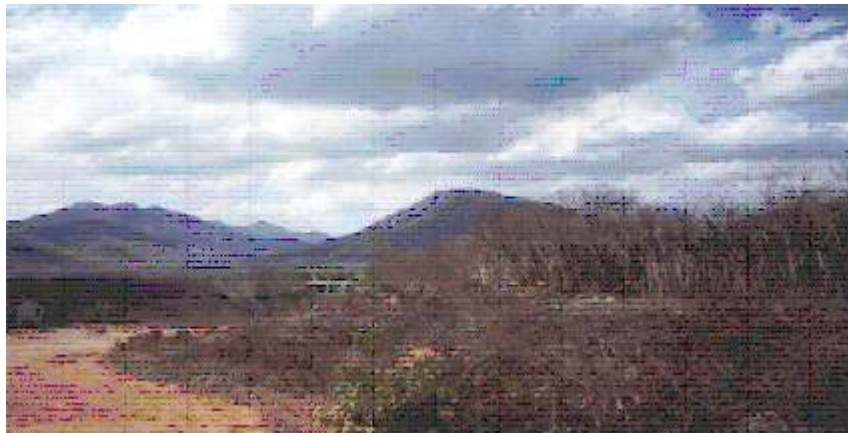
Foto 4 - Localidade Várzea do Gado próximo as Serras do Complexo Itatira,

O que se questiona é como uma população de 128.456 habitantes (Censo-IBGE, 1991), permanece na zona rural da bacia. Num sofrimento permanente, dependente das condições atmosféricas e na esperança de que um dia, tudo vai mudar. Essa persistência e perseverança é que faz a diferença do sertanejo nordestino, seu apego a terra o faz passar privações e humilhações atroz.