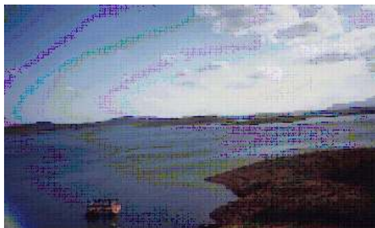
F. M. Soares / Jan de 1999