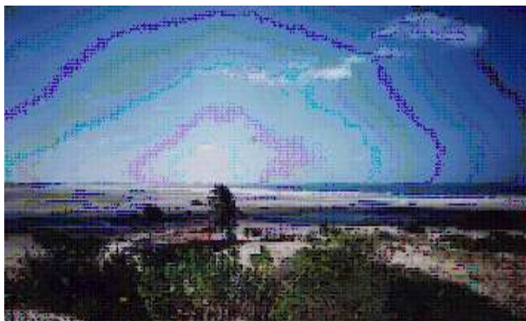
F. M. Soares / Dez de 1999