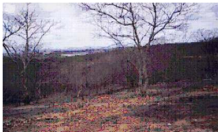
F. M. Soares / Dez de 1998