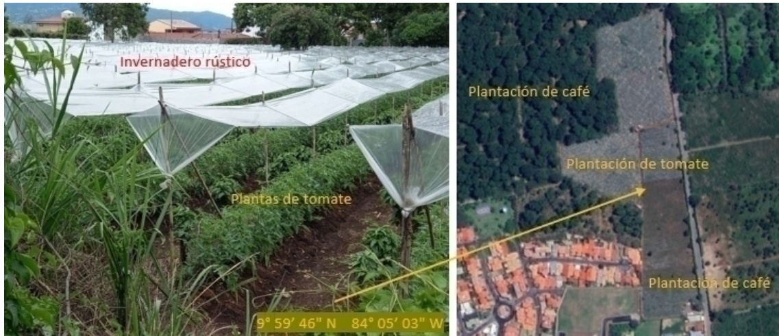
Figura 2- Cultivo de tomate en el interior de una plantación de café en el sector de Quintanas Norte, Santo Domingo de Heredia.

pecuaria destaca un desarrollo incipiente de una ganadería de leche, del tipo caprina y ovina, esto en localidades como Tierra Blanca de San Isidro. Esta actividad se acompaña con el desarrollo de pastos para su alimentación (Ver figura 3).