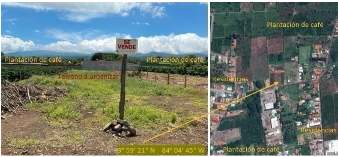
Figura 4- Inmediaciones del Residencial Quizarco en Santo Domingo de Heredia. Se observa la lotificación de terrenos, antes agrícolas, para procesos de urbanización.

Parte de las transformaciones recientes en la periferia tiene que ver con la conversión de suelos agrícolas para el establecimiento de usos urbanos (Ver figura 4), esta vez, caracterizado por la emergencia de condominios. Este tipo de inmueble se compone de diferentes residencias y amenidades en la misma superficie del terreno, contrastando con las viviendas unitarias situadas a un lado de las vías principales. Los propietarios de los condominios son de clase media o alta y destacan los beneficios de la cercanía del medio urbano como del rural, con atributos como una menor concentración poblacional, mayor tranquilidad, calidad ambiental y la cercanía a sitios de esparcimiento como parques naturales (Fernández et al.2021).