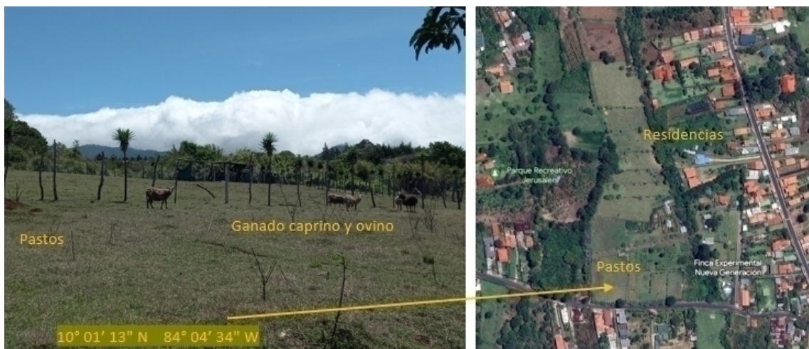
Figura 3- Pastos dedicados a ganadería caprina y ovina en el sector de Tierra Blanca, Santo Domingo de Heredia.

En la periferia, junto a la diversificación productiva, también se viene dando un proceso de agriculturización en diversos terrenos, entendido como una expansión de las actividades agrícolas (Vasquez & Zulaica, 2014), en este caso de horticultura de hojas o frutícola como la fresa. Mientras que en los terrenos dedicados al agro se ha visto una expansión de la superficie de cultivo, en otros el proceso se ha implantado a expensas de pastos, bosques ribereños y charrales. Este fenómeno ha sido más evidente en la colindancia sur del cantón Santo Domingo, al borde del cañón del río Virilla, a partir de la producción de chile dulce y tomate, aprovechando antiguos terrenos cubiertos de pastos y charrales. Como parte de esta lógica productiva podría considerarse a los cafetales en desuso, que adquieren nuevos bríos, en términos de una reactivación de la producción primaria, por la incursión de sistemas hortícolas.