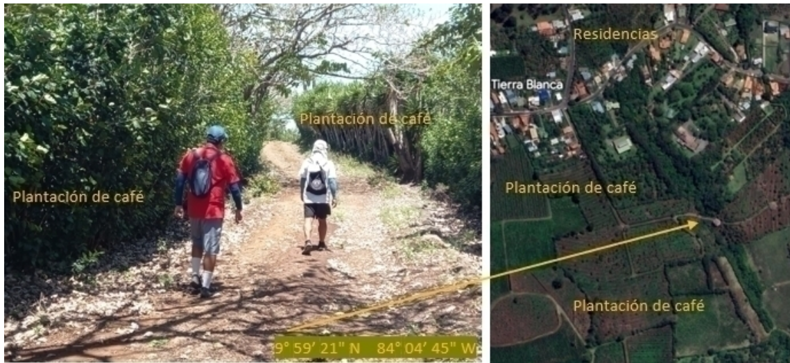
Figura 5 - Caminantes en vías internas de fincas cafetaleras. Sector Tierra Blanca, en San Isidro de Heredia. Además de caminantes, por estas mismas vías, se da una circulación de ciclistas, principalmente los fines de semana.

Para el caso del ciclismo, hemos constatado que la actividad está asociada con las condiciones accidentadas del terreno, el cual evoca a la práctica del mountain bike, esto de manera diurna y durante los fines de semana.